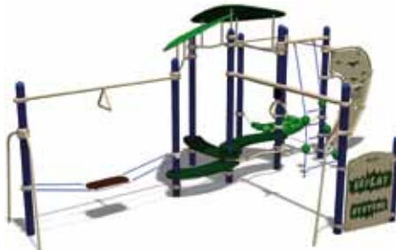
TEENAGER PARK UL-RP12-02 page 148