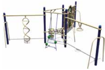
TEENAGER PARK UL-RP14-07 page 146