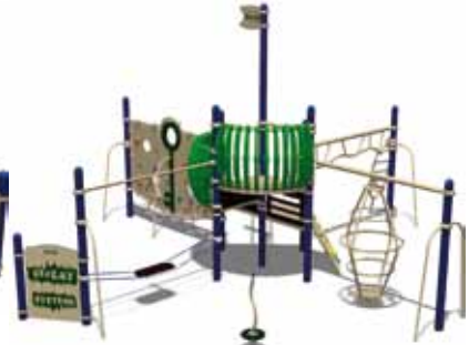
TEENAGER PARK UL-RP15-06 page 149