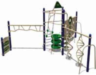
TEENAGER PARK UL-RP14-03 page 146