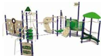
TEENAGER PARK UL-RP14-05 page 151