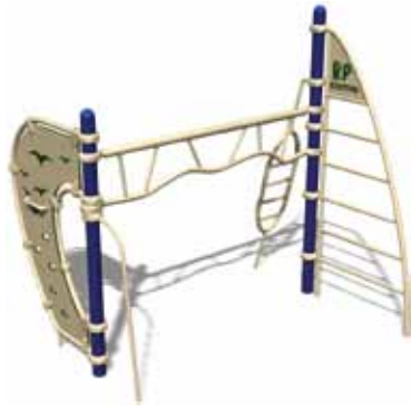
TEENAGER PARK UL-RP11-03 page 145