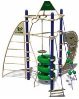
TEENAGER PARK UL-RP11-02 page 145