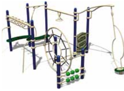
TEENAGER PARK UL-RP15-07 page 147