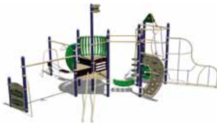
TEENAGER PARK UL-RP13-05 page 150