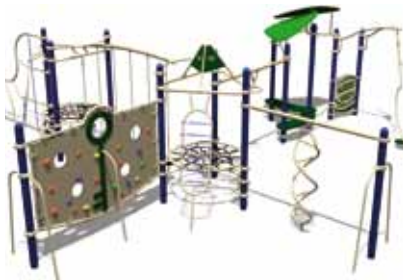
TEENAGER PARK UL-RP15-08 page 149