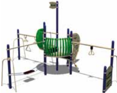
TEENAGER PARK UL-RP13-06 page 148