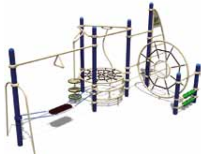
TEENAGER PARK UL-RP12-03 page 147